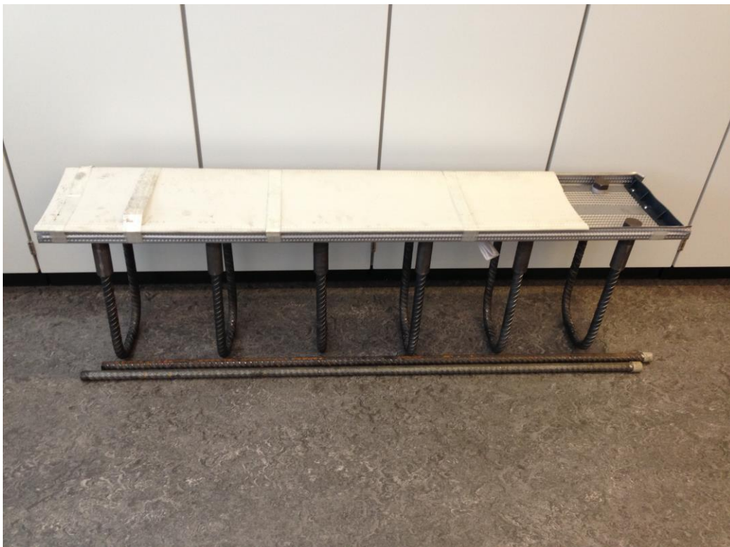
Modell, NCC Gardermoen 2013